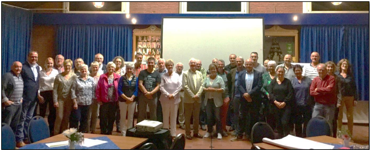
Afb. 1 De enthousiaste groep deelnemers uit Bingelrade

Heeft u vragen of opmerkingen over het verslag, dan horen wij dat graag van u. U kunt uw reactie sturen naar nathalie.heerings@nuth.nl