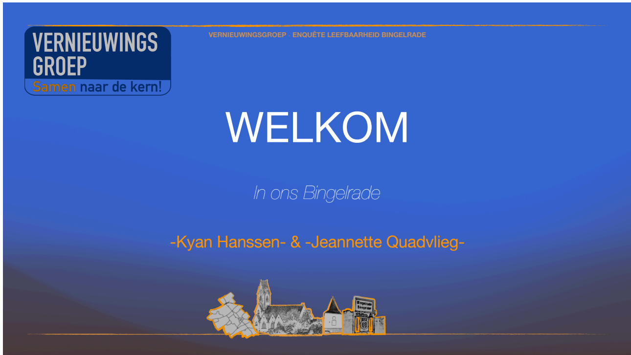
Dia 1: Welkom